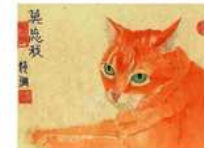
Aquarelle Wang Kuan Shan

Celui qui ne cherche ni à tromper, ni à mentir, ni à être malhonnête envers ses semblables, mais qui les connaît au premier regard, est un homme sage.